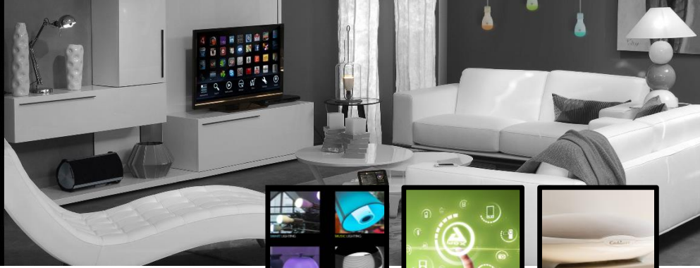
SMART & HYBRID LIGHTING